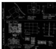
2. Quadro síntese.